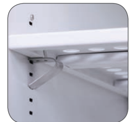
Supports d'étagère inclus